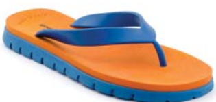
AZZURRO 50 ARANCIO 2 AZZURRO 50