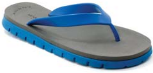
AZZURRO 50 ANTRACITE 27 AZZURRO 50