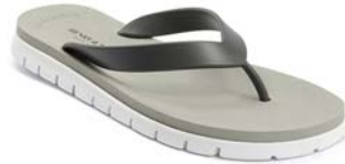
ANTRACITE 27 GRIGIO 53 BIANCO