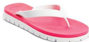
BIANCO FUCSIA FLUO 35 BIANCO