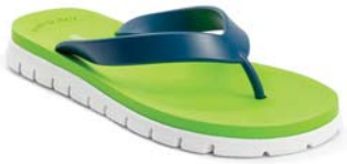
PETROLIO 11 VERDE 6 BIANCO