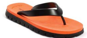
NERO ARANCIO FLUO 37 NERO