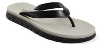
NERO GRIGIO 53 NERO