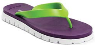
VERDE 6 VIOLA 20 BIANCO