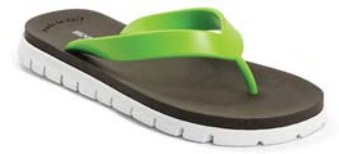
VERDE 6 TESTA DI MORO 29 BIANCO