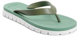
VERDE 51 VERDE 66 BIANCO