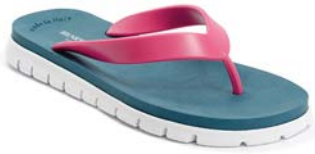
FUCSIA 65 PETROLIO 11 BIANCO