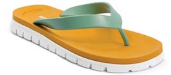
VERDE 66 ARANCIO 54 BIANCO