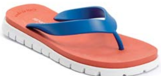
AZZURRO 50 ARANCIO 1 BIANCO