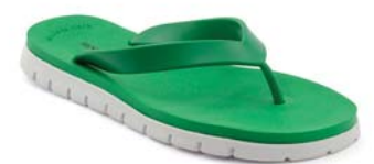
VERDE 63 BIANCO