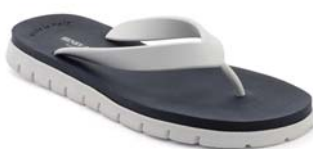
BIANCO NAVY 28 BIANCO