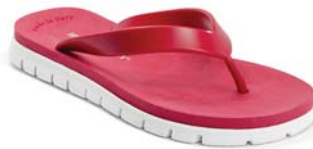
ROSSO 55 BIANCO